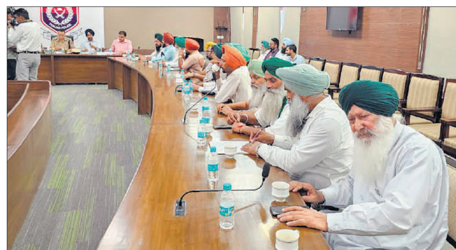
Farmer union leaders and police officials from Punjab and Haryana hold a meeting in Patiala.

"The way forward is the key and we are willing to sit with the farmer unions again to resolve the issue," they said. "Certain issues, including the farmers being