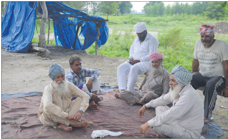
TOO CLOSE TO HOMES

On January 15 this year, the MC, with the support of administration officials and the police, managed to make the plant operational for 10